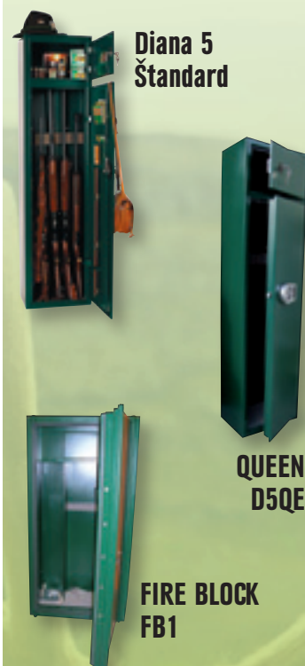
Diana 5 Štandard

Vysoká kvalita za prekvapivo nízke akciové ceny